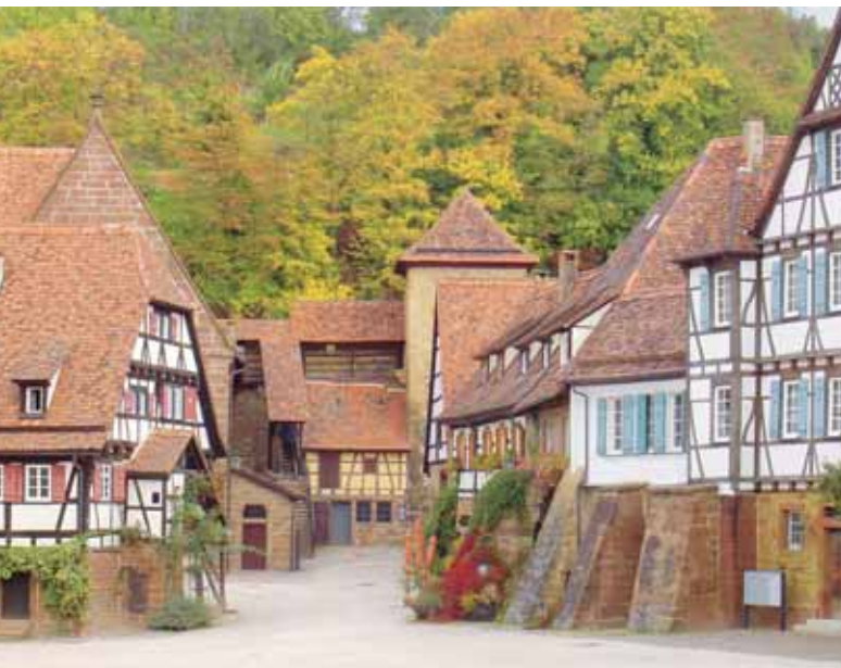
Der Ausflug: Das Kloster Maulbronn bietet viel Sehenswertes.