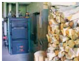
Solche Heizanlagen werden künftig auch kontrolliert.

■ Künftig werden auch kleine Holzfeuerungen regelmässig kontrolliert. Dies ist eine Konsequenz aus der eidgenössischen Luftreinhalteverordnung LVR. Sie verlangt nebst der Kontrolle von Oel- und Gasheizungen nun auch, dass Holzöfen, die als Hauptfeuerung eines Gebäudes dienen, bis zu einer Leistung von 70 Kilowatt kontrolliert werden. Das Brennstofflager wird geprüft und die Asche analysiert. Damit soll erreicht werden, dass nur unbehandeltes Holz verbrannt wird, das keine schädlichen Abgase in unsere Luft entlässt.