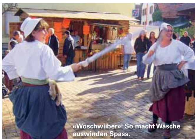
«Wöschwiiber»: So macht Wäsche auswinden Spass.

einfach persönlich bei uns vorbei. Landschaft, Geschichte und Kultur verbinden sich in Kraichtal auf ideale Weise. Wir freuen uns