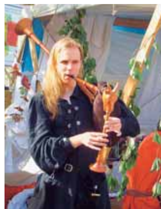
Markige Töne: Dudelsackbläser mit «Geissengrind».

Kraichtaler Stadtteil Oberacker und Ihrer Gemeinde Oberägeri entstanden. Dieser Partnerschaft schlossen sich weitere Familien an, unter denen sich viele schöne und herzliche Freundschaften entwickelten. Jährliche gegenseitige Besuche von Gruppen – einmal in der Schweiz, einmal im Kraichgau – festigten die Bande bis heute. Besonders gefreut hat es mich, dass ich bei unserem diesjährigen Dorfmarkt in Oberacker, Anfang Oktober, neben zahlreich erschienenen Gästen aus unserer Region, auch eine Gruppe aus Oberägeri im Kanton Zug in der geschichtsträch-