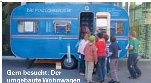
Gern besucht: Der umgebaute Wohnwagen des Schweizerischen Lehrerinnen- und Lehrervereins.

Die Forscherkiste ist ein Wohnwagen, der von Schulen wochenweise gemietet werden kann. Er enthält Experimente, Spiele und Phänomene für den naturwissenschaftlichen Unterricht auf allen Stufen. Die Kinder erforschen dabei interessante Fragen zu zweit oder zu dritt.